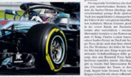
Lewis Hamilton vor dem Start zum Großen Preis von Ungarn

Die anderen Fahrer haben ein schwieriges Rennen erlebt, da die Temperaturen sehr hoch waren. Das hat die Reifen verschlisselt und hat die Fahrer gezwungen, strategische Entscheidungen zu treffen. In der концовка haben die Sauber-Piloten eine gute Leistung gezeigt, aber sie sind nicht imstande gewesen, den Kampf um den Sieg zu gewinnen.