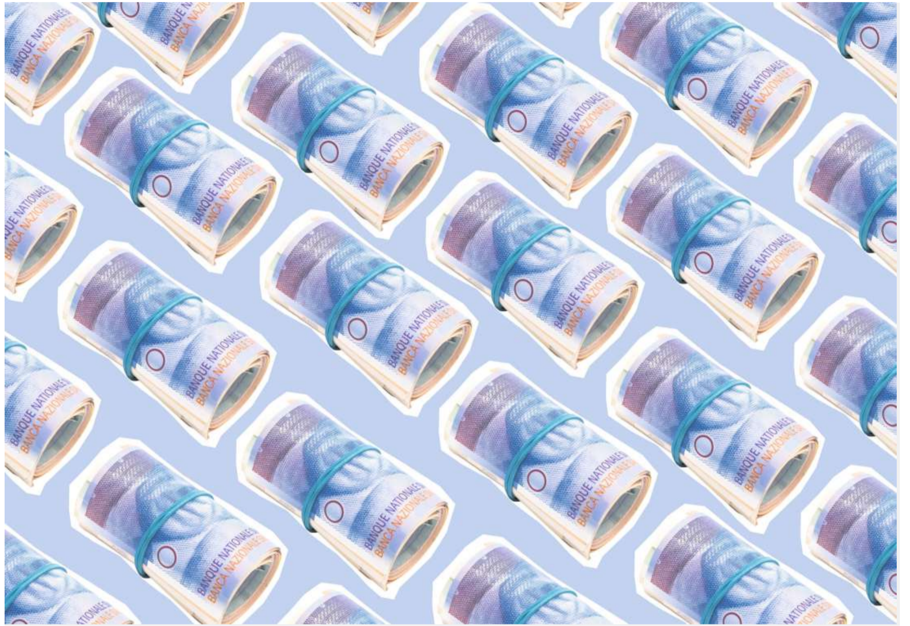
Innovative Fintechs wie iCapital haben Lösungen entwickelt, welche die Komplexitäten im Zusammenhang mit Investitionen in die Privatmärkte aufbrechen.

All diese Punkte werfen die Frage auf, warum private Anleger historisch unterinvestiert waren und was getan werden kann, um hier Gegensteuer zu geben. Der Grund für die Unterallokation liegt in drei Schlüsselbereichen: im Zugang zu Investitionsmöglichkeiten, in der Technologie und, am wichtigsten, in