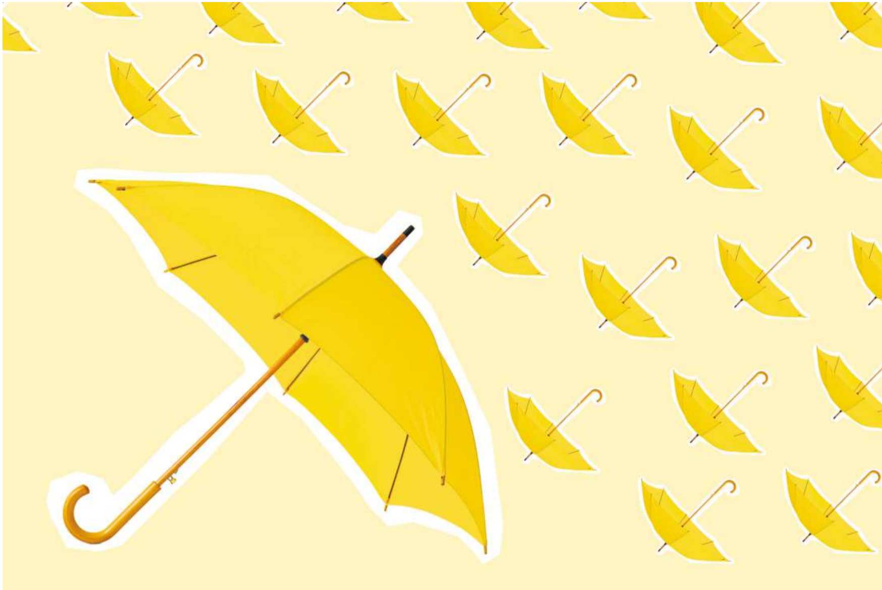
Anlegerinnen und Anleger können in Private Debt auch in Zeiten wirtschaftlicher Unsicherheit stabile und attraktive Renditen erzielen.