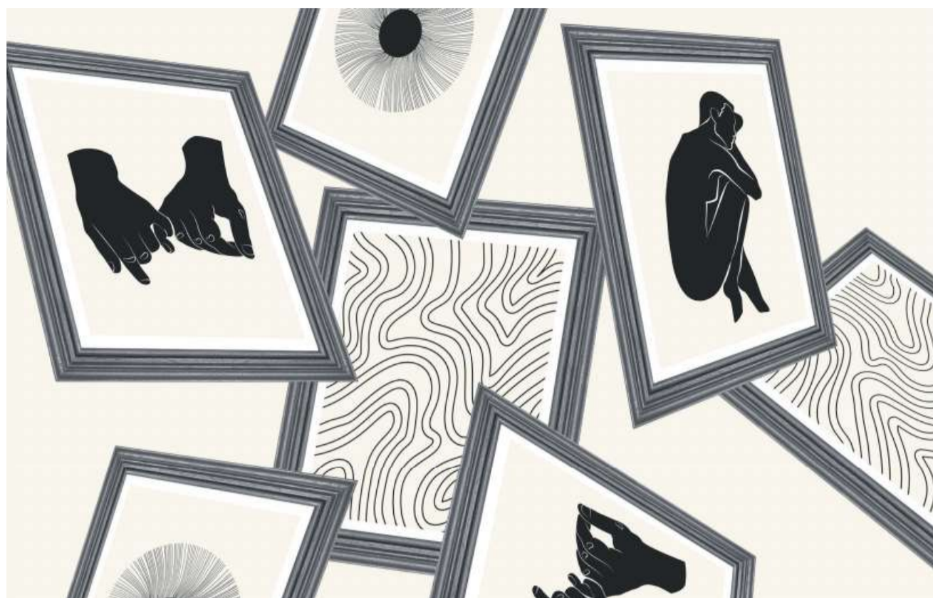
Die Akteure des Kunstmarktes verweisen gerne auf Wertsteigerungen, die sich mit Gemälden erzielen lassen.

Die Fantasie wird regelmässig befeuert, wenn wieder von Rekordpreisen bei Auktionen berichtet wird.