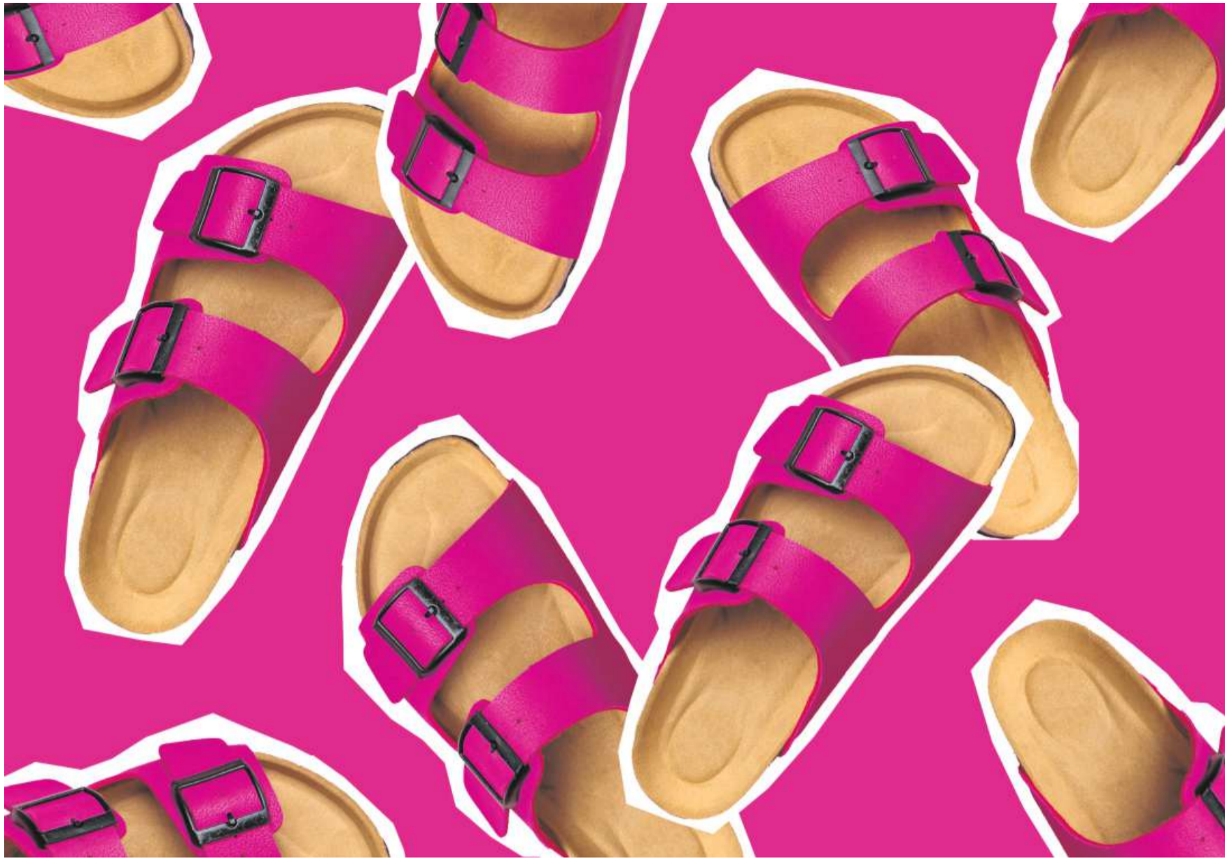
Birkenstock war einer der am meisten erwarteten europäischen Börsengänge der letzten Jahre.