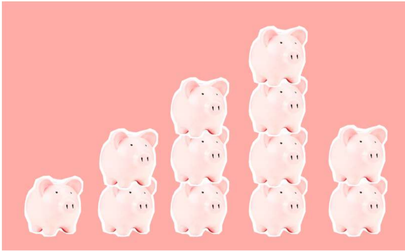
Immer mehr Startups warten mit dem IPO bis sie eine Bewertung von mehr als 1 Milliarde US-Dollar erreichen.

Mit European Long-Term Investment Funds (ELTIFs) erhalten Investoren Zugang zu Anlagen an privaten Märkten. Um semi-liquide Anlagestrategien zu erleichtern, wurde das 2015 eingeführte ELTIF-Regime unlängst von den EU-Behörden überarbeitet. Dank des Passporting-Mechanismus können ELTIFs an alle Anlegertypen einschliesslich Privatanleger in der gesamten EU vermarktet werden.