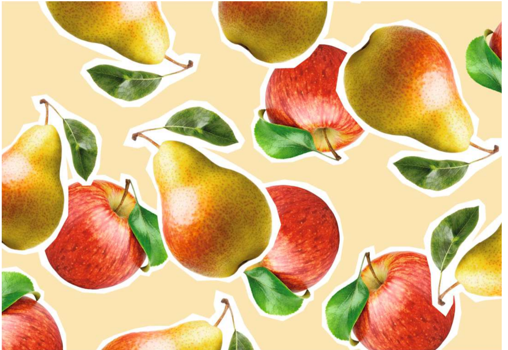
Wenn thematische Produkte als Ergänzung zu einem Kernportfolio hinzugefügt werden, können die Risiken des Portfolios reduziert werden.

Doch aufgepasst: Themenfonds können phasenweise grösseren Schwankungen ausgesetzt sein, wenn ein Megatrend, derzeit beispielsweise künstliche Intelligenz, bei den Investorinnen und Investoren plötzlich in aller Munde ist, hohe Erwartungen weckt und entsprechende Gelder auf sich zieht – oder bei Anlegerinnen und Anlegern aus Aktualitätsgründen kurzfristig wieder aus den Traktanden fällt. Gleichzeitig verändern sich Themen über die Zeit sehr dyna-