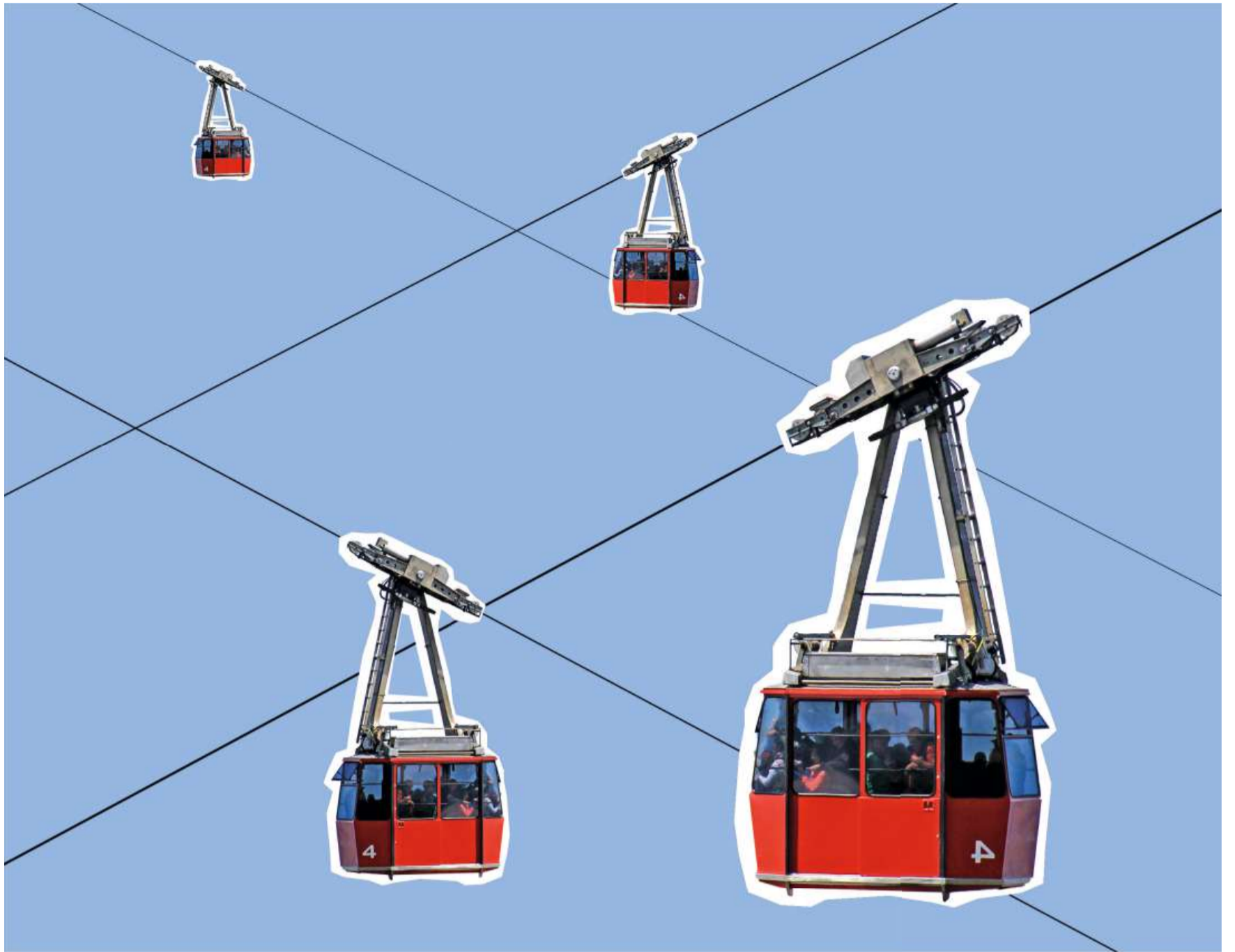
Bei den Titeln der Bergbahnen stammen viele Investoren aus der Region und stehen direkt oder indirekt mit den Bergbahnen in Verbindung.